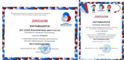
Городская декада «Копилка добра»